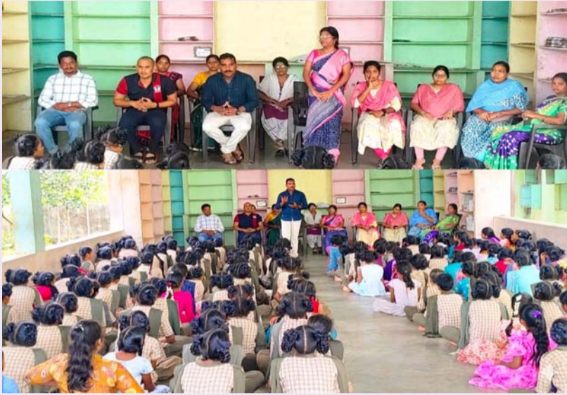
1930 సహాయ కేంద్రానికి సమాచారం అందించాలని తెలిపారు. గంజాయి, ఇతర మత్తు పదార్థాల వినియోగం యువత జీవితాలను నాశనం చేస్తోందని ఆవేదన వ్యక్తం చేశారు. గ్రామాల్లో ఎవరైనా గంజాయి విక్రయించడం, రవాణా చేయడం లేదా వినియోగించడం గమనిస్తే వెంటనే