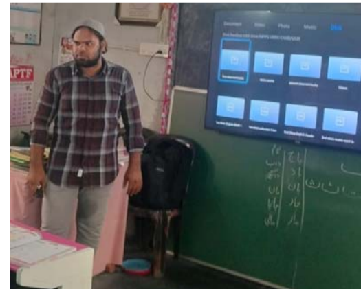
మెరుగైన భవిష్యత్తును అందించాలని కోరారు. విద్యార్థుల తల్లి దండ్రులు బడి ఈడు పిల్లలను ప్రభుత్వ బడిలో చేర్పించాలని కోరారు.