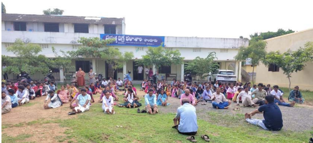
చూపిస్తూ విద్యార్థులతో ఆసనాలు చేయించారు. ప్రాణాయామం కార్యక్రమంలో బోధన బోధనేతర సిబ్బంది, విద్యార్థిని ధ్యానం యొక్క ప్రాముఖ్యతను ప్రాక్టికల్ గా వివరించారు. ఈ విద్యార్థులు పాల్గొన్నారు.