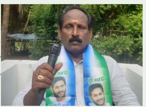
అజేబ్ క్రోసీమ జిల్లా జూన్ 20(ప్రజా జ్యోతి ప్రతినిధి) కృష్ణాలంక లాకప్ డెత్ వెనుక ఉన్న సూత్రదారులు ఎంత పెద్ద స్టేజి లో ఉన్నారని దర్యాప్తు చేసిన అనలు దోసులను పట్టం ముందు నిలబెట్టి శిక్షించాలి.