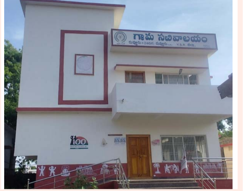
సారించి, సిబ్బంది కొరతకు తగిన చర్యలు తీసుకోవాలని ప్రజలు కోరుకుంటున్నారు.

ప్రభుత్వ సేవలందక ప్రజల అవస్థలు సెలవులలో డిజిటల్ అసిస్టెంట్, ఇంచార్జి పాలసతో పంచాయతీ కార్యదర్శి విధులు నిర్వహణ పట్టి పట్టినట్లు వ్యవహారిస్తున్న అధికారులు దువ్వూరు, జూన్ 16 (ప్రజా జ్యోతి) దువ్వూరు సచివాలయం -1 ఉద్యోగుల కొరత వేధిస్తోంది. చిన్న పని కోసం కూడా ప్రజలు రోజుల తరబడి సచివాలయం చుట్టూ ప్రదక్షిణ చేయాల్సి వస్తోంది. పనులు జరగకపోవడంతో నిరాశతో వెనుదిరుగుతున్నారు. దువ్వూరు మండల కేంద్రంలోని సచివాలయం -1 లో గ్రామ సచివాలయంలో అసలు సేవలు ప్రజలకు అందుతున్నాయా? లేదా అనే సందేహం ప్రజలు వ్యక్తం చేస్తున్నారు. ప్రధానంగా జనన, మరణ డ్రువీకరణ పత్రాలు, కుల డ్రువీ కరణ పత్రాలు, రేషన్ కార్డులో మార్పులు, చేర్పులు తదితర వాటికోసం నిత్యం ప్రజలు సచివాలయానికి వెళుతుంటారు. ఈ సేవలన్నీ డిజిటల్ అసిస్టెంట్ ద్వారా పొందాల్సి ఉంటుంది. సచివాలయానికి సిబ్బంది లేక తాళాలు వేస్తున్న పరిస్థితి నెలకొంది. సచివాలయంలో సిబ్బంది లేక, ప్రజలకు సేవలు అందక ఇబ్బందులు పడుతున్నారు. ఇది ఇలా ఉంటే గత కొన్ని రోజులుగా సచివాలయంలోని ప్రింటర్, ఇన్ స్టర్ట్ పనిచేయకపోవడం, దీనిపై ఉన్నతాధికారులు దృష్టి పెట్టారా? ప్రజలకు సేవలు అందించే విధంగా చర్యలు తీసుకోరా? అని ప్రజలు ప్రశ్నిస్తున్నారు. దీనిపై ఉన్నతాధికారులు దృష్టి