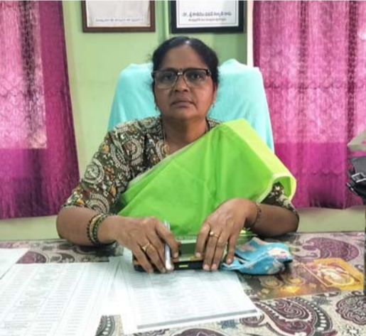
భాగస్వాములు కావాలని కోరారు.