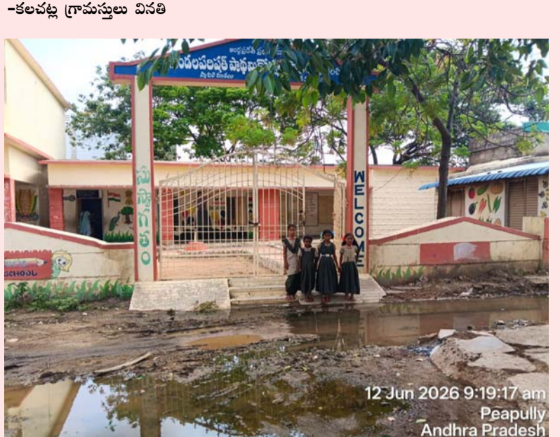
12 Jun 2026 9:19:17 am Peapully Andhra Pradesh

పాపిలి ప్రజా జ్యోతి జూన్ 12: మండలంలోని కల చెట్ల గ్రామంలో డ్రైనేజి సౌకర్యం లేకపోవడంతో గ్రామస్థులు తీవ్ర ఇబ్బందులు ఎదుర్కొంటున్నారు. ముఖ్యంగా పాఠశాల మరియు నివాసాల పరిసర ప్రాంతాల్లో మురుగునీరు వీధుల్లో నిల్వ ఉండి దుర్వాసన వెదజల్లుతోంది. నివాసాల మధ్యగా మురుగునీరు ప్రవహిస్తుండటంతో ప్రజలు రాకపోకలకు ఇబ్బందులు పడుతున్నారు. వర్షాకాలంలో పరిస్థితి మరింత దయనీయంగా మారుతోందని గ్రామస్థులు ఆవేదన వ్యక్తం చేస్తున్నారు. వీధుల్లో బురద, నీటి నిల్వలు అధికంగా ఉండటంతో చిన్నపిల్లలు, వృద్ధులు జారిపడి ప్రమాదాలకు గురయ్యే అవకాశం ఉందని తెలిపారు. మురుగునీటి నిల్వలు కారణంగా దోమలు విపరీతంగా పెరిగి, అంటువ్యాధులు వ్యాపించే ప్రమాదం నెలకొన్నందున ప్రజలు ఆందోళన వ్యక్తం చేస్తున్నారు. సమస్యను ఎన్నిసార్లు అధికారుల దృష్టికి తీసుకెళ్లినా ఇప్పటివరకు శాశ్వత పరిష్కారం లభించలేదని వాపోయారు. అందువల్ల గ్రామంలో శాశ్వత డ్రైనేజి కాలువలను నిర్మించి మురుగునీటి సమస్యకు వెంటనే పరిష్కారం చూపాలని గ్రామస్థులు స్పెషల్ ఆఫీసర్ల పాటు గ్రామపంచాయతీ అధికారులను కోరుతున్నారు. ప్రజాకోర్కాన్ని దృష్టిలో ఉంచుకుని అధికారులు తక్షణమే స్పందించి డ్రైనేజి ఏర్పాటు పనులు చేపట్టాలని స్థానిక ప్రజలు విజ్ఞప్తి చేశారు.