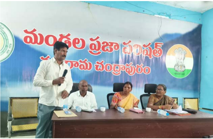
అనుకున్న సమయానికి వ్యవసాయపనులు చేయలేక పోతున్నాం.. తీవ్రంగా సజ్జహించుకున్నాం.. పరద సమీక్షలో నాయకులు..