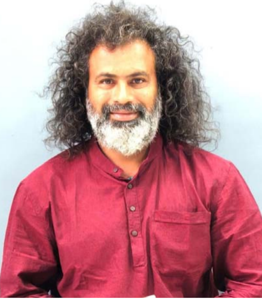
కాపాడుకోవాలని వారు ఉమ్మడి జిల్లాల ప్రజలకు విజ్ఞప్తి చేశారు

ఎన్నో ఏళ్లు పడుతుంది. అలాంటిది క్షణికావేశంలో లేదా అజ్ఞానంతో చెట్లను నరికితే రాబోయే తరాలకు ఆక్సిజన్ కొరత, తీవ్రమైన ఎండలు, పర్యావరణ సమతుల్యత దెబ్బతినడం వంటి శాపాలు తప్పవు. చట్టపరమైన చర్యలు తప్పవు: అటవీ శాఖ నియమ నిబంధనల ప్రకారం పచ్చని చెట్లను నరకం చట్టరీత్యా నేరం హెచ్చరికలను జేఖాతరు చేస్తూ ఎవరైనా చెట్లను నరికితే వారిపై కఠినమైన సెక్షన్ల కింద కేసులు నమోదు చేయిస్తామని ఆయన స్పష్టం చేశారు. కమిటీల బాధ్యత ప్రతి గ్రామంలోని మొహరం ఉత్సవ కమిటీలు ముందస్తుగానే గ్రామస్థులకు ఈ విషయమై అవగాహన కల్పించాలి పచ్చని ప్రకృతి మధ్య పండుగను ప్రశాంతంగా జరుపుకోవాలి "ప్రకృతిని పూజించడమే నిజమైన భక్తి పచ్చని చెట్లను నరికి భగవంతుడికి ఆగ్రహం తెప్పించవద్దు పర్యావరణ ప్రేమికులు స్వచ్ఛంద సంస్థలు మరియు చైతన్యవంతమైన పౌరులందరూ గ్రామాల్లో తిరిగి ఈ విషయమై ప్రజలను అప్రమత్తం చేయాలి. రాజయోగి డాక్టర్ భాస్కర్ నాయుడు పిలుపునిచ్చారు. కావున ఈ మొహరం పండుగను పర్యావరణ హితంగా జరుపుకుని ప్రకృతిని