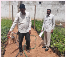
నిడమనూరు, జూన్ 24 (ప్రజాజ్యోతి):

నిడమనూరు మండలంలోని పార్వతీపురం గ్రామాల్లో ఇన్సాల్డ్ ఎంపీడివో ఇమామ్ బుధవారం ఆకస్మిక తనిఖీలు నిర్వహించారు. పంచాయతీ పరిధిలోని పల్లె ప్రకృతి వనం, ఉపాధి హామీ పనులు, నర్సరీని పరిశీలించి అధికారులకు తగు సూచనలు చేశారు. అనంతరం గ్రామ పంచాయతీ రికార్డులను తనిఖీ చేశారు. నిబ్బంది బాధ్యతాయుతంగా పనిచేయాలని ఆదేశించారు. కార్యక్రమంలో సర్పంచ్, పంచాయతీ కార్యదర్శులు, ఫీల్డ్ అసిస్టెంట్లు పాల్గొన్నారు.