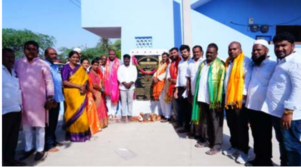
-పలు అభివృద్ధి పనులకు శంకు స్థాపనలు చేసిన