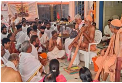
అయ్యప్ప ఆలయంలో లక్ష పుష్పార్చన... రుద్ర పారాయణం, శ్రీ సూక్త పారాయణం