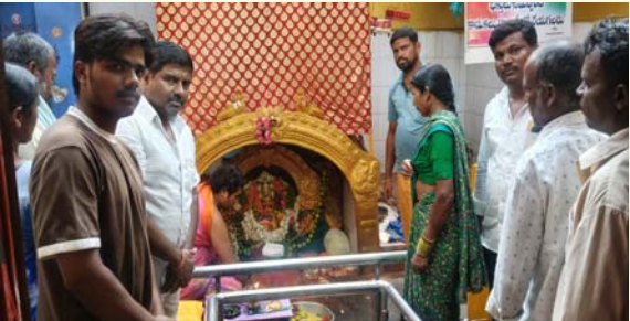
కొడిపల్లి ప్రజా జ్యోతి జూన్ 14 కోరిన కోరికలను తీర్చి భక్తుల కొంగుబం

నల్ల పోచమ్మ ను దర్శించుకున్న భక్తులు శివశక్తుల పూనకాలు పోచమ్మ తల్లికి జే అంటూ మారుమోగిన ఆలయం