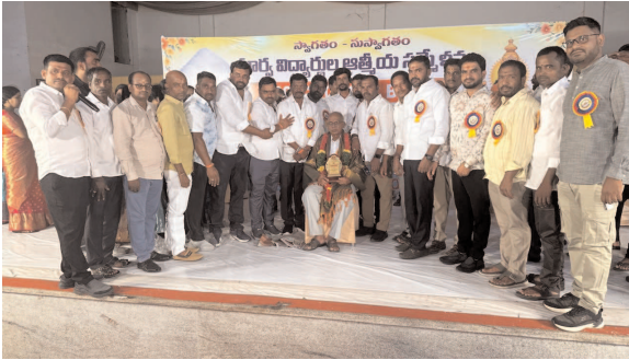
-పాతికేళ్ల తర్వాత గురువులతో కలయిక..

జిన్నారం జడ్పీ ఉన్నత పాఠశాల 2000-2001 బ్యాచ్ సిల్వర్ జూబ్లీ వేడుకలు.