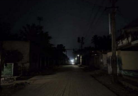
పరిష్కారం చూపాలని డిమాండ్ చేశారు. నిరంతర విద్యుత్ ఇవ్వాలని కోరారు.

ఆసిఫాబాద్ జూన్ 16 ప్రజా జ్యోతి కొమురంభీం ఆసిఫాబాద్ జిల్లా వాంకిడి మండలం లోని ఖమన గ్రామం లో చిన్నపాటి వర్షం పడ్డా, గాలొచ్చినా ఖమన గ్రామంలో కరెంట్ కట్ అవుతోందని గ్రామస్థులు మండిపడుతున్నారు. గంటల తరబడి చీకట్లోనే మగ్గాల్ని వస్తోందని వాపోయారు. పక్క ఊళ్లలో కరెంట్ ఉన్నా ఖమనలో మాత్రం వెంటనే పోతోందని ఆరోపించారు. ఇది కొత్త కాదని, ఏళ్ల తరబడి ఈ సమస్య వెంటాడుతోందని ఆవేదన వ్యక్తం చేశారు. కరెంట్ కోతలతో పిల్లల చదువులు, రైతుల పనులు, చిన్న వ్యాపారాలు అన్నీ దెబ్బతింటున్నాయని గ్రామస్థులు తెలిపారు. విద్యుత్ అధికారులు వెంటనే స్పందించి లైన్లు, ట్రాన్స్ ఫార్మర్లు బాగు చేసి శాశ్వత