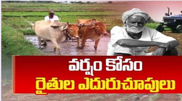
వర్షం కోసం రైతుల ఎదురుచూపులు

తొలి వానల కోసం ఆకాశం వైపు ఆశగా చూస్తున్న అన్నదాతలు దుక్కులు దున్ని, విత్తనాలు సిద్ధం చేసినా ముందుకు సాగని సాగు నిర్మల్ జిల్లాలో వర్షాధార వ్యవసాయంపై తీవ్ర ప్రభావం చూపడం మండలం ప్రజాజ్యోతి ప్రతినిధి ఎలిగేటి వంశీ కృష్ణ నేత ఆలస్యమవుతున్న నైరుతి రుతుపవ నాలతో రైతుల్లో పెరుగుతున్న ఆందోళన