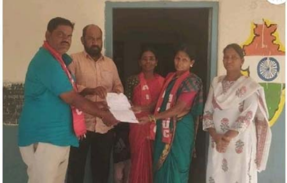
పట్టణం కూడా.. ప్రైవేట్ స్కూల్. ఇచ్చోడ మండల్.. హెడ్ మాస్టర్ గారికి ఇవ్వడం జరిగింది