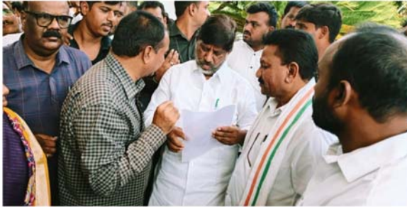
వినతిపత్రంలో కోరారు. ఆసిఫాబాద్ నియోజకవర్గ అభివృద్ధికి సంబంధించిన ప్రతిపాదనలను పరిశీలించి తగిన చర్యలు తీసుకుంటామని ఉప ముఖ్యమంత్రి భట్టి విక్రమార్కు హామీ ఇచ్చినట్లు నాయకులు తెలిపారు.