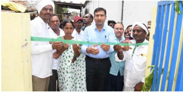
జిల్లా కలెక్టర్ రాజర్షి షా

ఆదిలాబాద్ బ్యూరో, జూన్ 8 (ప్రజా జ్యోతి) గ్రామాల్లో మౌలిక వసతుల కల్పన, సమగ్ర రూపాంతరం కేవలం ప్రజా భాగస్వామ్యంతోనే సాధ్యమవుతుందని జిల్లా కలెక్టర్ రాజర్షి షా స్పష్టం చేశారు. ప్రజాపాలన - ప్రగతి ప్రణాళికలో భాగంగా సోమ వారం నార్సూర్ మండలం కొత్తపల్లి (హెచ్) గ్రామంలోని నిర్వహించిన గ్రామ సభకు ఆయన ముఖ్య అతిథిగా హాజరయ్యారు. గ్రామసభలో గ్రామస్తుల నుంచి సమస్యలను నేరుగా అడిగి తెలుసుకున్న కలెక్టర్ వాటి పరిష్కారానికి తక్షణమే నివేదికలు సిద్ధం చేయాలని అధికారులను ఆదేశించారు. గ్రామాల్లో పారిశుధ్యం, తాగునీరు, అంతర్గత రహదారుల నిర్మాణానికి ప్రభుత్వం ప్రాధాన్యత ఇస్తోందని, నిధులను సద్వినియోగం చేసుకుంటూ నాణ్యతతో పనులు పూర్తి చేయాలని ప్రజా ప్రతినిధులకు, అధికారులకు సూచించారు. అనంతరం కలెక్టర్ మాట్లాడుతూ, జిల్లాలోని వ్యవసాయం వర్ష పాతంపైనే ఆధారపడి ఉన్నందున, రైతులు వాతావరణ పరిస్థితులకు అనుగుణంగా