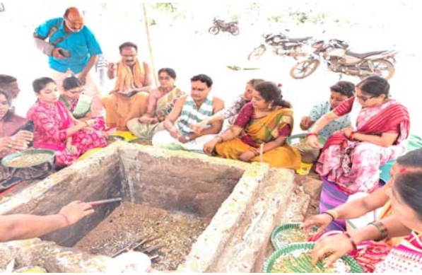
ఖానాపూర్ లో ఘనంగా పంచముఖ హనుమాన్ సప్త మహోత్సవం