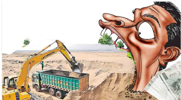
మణుగూరు, జూన్ 05 (ప్రజాజ్యోతి) :

- గోదారమ్మ గర్భాన్ని తోడేస్తూ... "నన్ను కాపాడండి" అంటూ ఘోషిస్తున్న గోదావరి