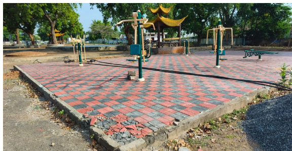
కొత్తగూడెం, జూన్ 5 (ప్రజాజ్యోతి)

పూర్తికాని పనులు.. పెరుగుతున్న అసాంఘిక కార్యకలాపాలు - క్రీడలకు బదులు మద్యం పార్టీలే..!