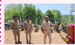
పాల్వంచ, జూన్ 5, ప్రజాజ్యోతి:

?సాంకేతిక నైపుణ్యాలు పెంపొందించుకోవాలని సిబ్బందికి సూచన.