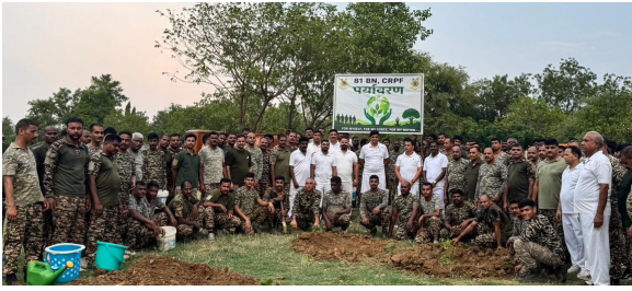
చర్ల, జూన్ 05 : (ప్రజాజ్యోతి):