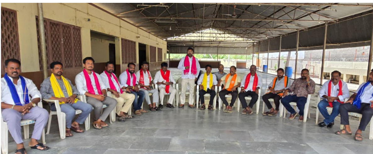
నార్కట్ పల్లి, జూన్ 29 ( ప్రజా జ్యోతి):

కాంగ్రెస్ పార్టీ అధికారంలోకి వచ్చి 30 నెలలు గడుస్తున్న ఇంతవరకు రోడ్లు పనులు నత్త నడకన జరుగుతున్నాయని అఖిలపక్ష కమిటీ ఆధ్వర్యంలో సోమవారం టిఆర్ఎస్, బిజెపి, సిపిఐఎం, సిపిఐ, టిడిపి, బి ఆర్పీ, బి ఆర్ ఎస్, మాల మహానాడు ఆధ్వర్యంలో సమావేశాన్ని ఏర్పాటు చేశారు. శ్రాహ్మణ వెల్లల గ్రామానికి చెందిన మంత్రి కోమటిరెడ్డి వెంకటరెడ్డి తన సొంత మండలంలో ఏ పని చేయకుండా కాలం కడుతున్నాడని, రెడ్డయ్య కంపెనీ నుండి లారీ యూనియన్ ఆఫీస్ వరకు ఉన్న రోడ్డుపై పక్క తవ్వి గుంతల మయం చేశారన్నారు. కామినేని జంక్షన్ నుండి సన్నెన్ కాలనీ వరకు రోడ్డును ఏర్పాటు చేయాలి అన్నారు. మేజర్ గ్రామపంచాయతీ సర్పంచ్ ఎన్నికల సమయంలో రోడ్డు మధ్యలో కరెంటు స్తంభాలు వేసి లైట్లు ఏర్పాటు చేయలేదని, గత కొద్ది కాలంగా నల్గొండ చౌరస్తాలో ఎన్ని ప్రమాదాలు జరిగినప్పటికీ, ఈ సంవత్సరం ముగ్గురు మృతి చెందిన అధికారులు మాత్రం ఏమాత్రం పట్టించుకోవడం లేదన్నారు. ప్రతినిత్యం ప్రజలు దుమ్ము దూశిత