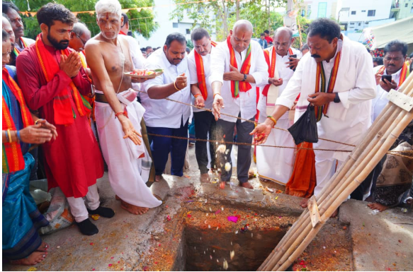
మిర్యాలగూడ, జూన్ 29, ( ప్రజాజ్యోతి ):