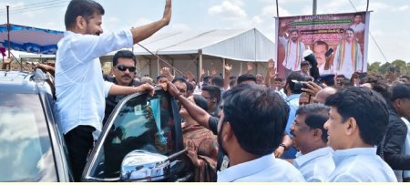
నాగర్ కర్నూల్ జూన్ 5 (ప్రజా జ్యోతి జిల్లా ప్రతినిధి)