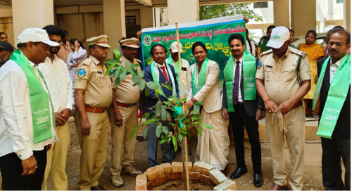
న్యాయవాదులు, కోర్టు సిబ్బంది పోలీస్ అధికారులు మరియు పౌరా లీగల్ వాలంటీర్లు కార్యక్రమం లో పాల్గొని మొక్కలు నాటారు.