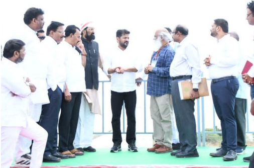
నాగర్ కర్నూల్ జూన్ 5 (ప్రజా జ్యోతి జిల్లా ప్రతినిధి)