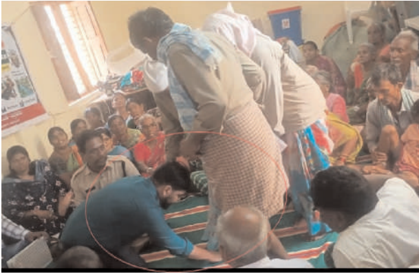
పారిశుధ్య కార్యకర్తల దేవుళ్లతో సమానం,ఎంపీడిఓ