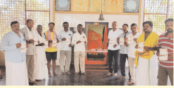
అడ్డాకుల, జూన్ 4 (ప్రజా జ్యోతి) :