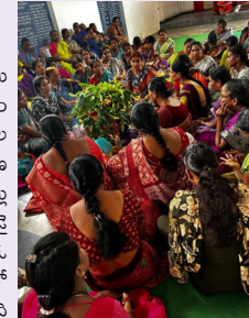
నాగర్ కర్నూల్ : జూన్ 29 (ప్రజా జ్యోతి)