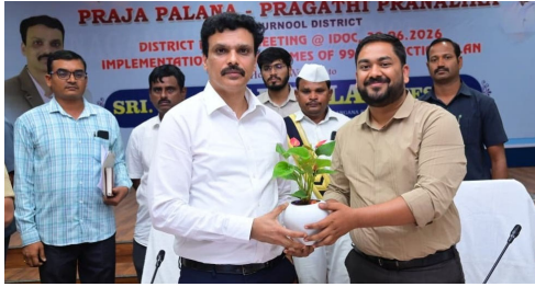
నాగర్ కర్నూల్ జూన్ 29 (ప్రజా జ్యోతి జిల్లా ప్రతినిధి)