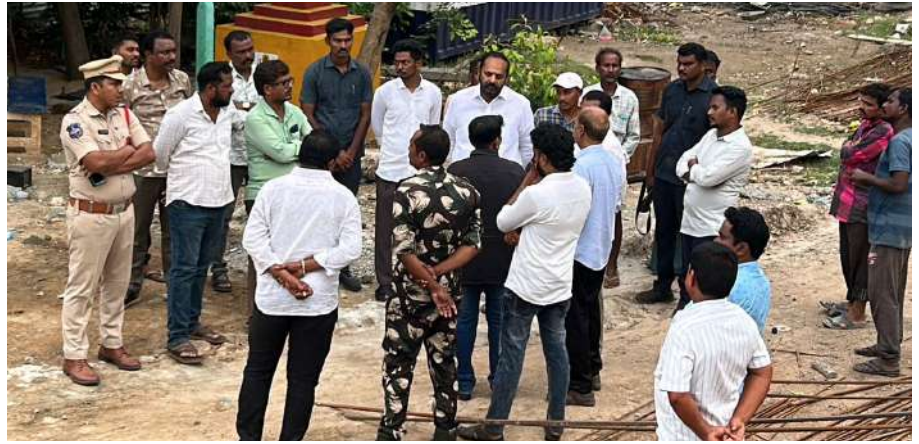
ఆరు నెలల్లో జిల్లా ఆసుపత్రి నూతన భవనం