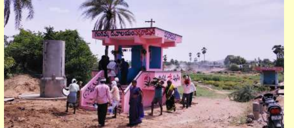
కోరుట్ల రూరల్, ప్రజాజ్యోతి, జూన్ 19) కోరుట్ల మండలంలోని సర్పరాజ్ పల్లి గ్రామంలో గంగమ్మ గుడి ప్రతిష్ఠాపన ఘనంగా జరిగింది. గ్రామస్తులంతా లా గంగమ్మ గుడి కి దప్ప సప్పులతోని బోనాలతో పిల్లాపాపలతో కలిసి సంబురంగా పండగ చేసుకున్నారు. ఈ కార్యక్రమంలో గ్రామ సర్పంచ్, ఉపసర్పంచ్, ఆలయ కమిటీ సభ్యులు, గ్రామ పెద్దలు, గ్రామ ప్రజలు తదితరులు పాల్గొన్నారు.