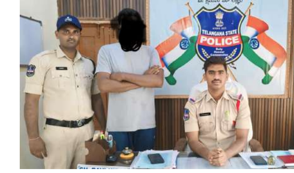
కథలాపూర్, జూన్ 16(ప్రజాజ్యోతి): పోలీసుల విధులకు ఆటంకం కలిగించి అనుచితంగా ప్రవర్తించిన వ్యక్తిపై కేసు నమోదు చేసి