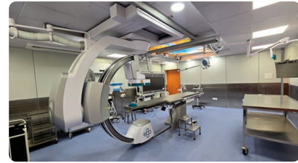
భద్రాద్రి కొత్తగూడెం జిల్లా ప్రతినిధి, జూన్ 29, ప్రజాజ్యోతి :

కోల్ బెల్ట్ ప్రాంత ప్రజలకు అత్యాధునిక గుండె వైద్య సేవలు మరింత చేరువ కానున్నాయి. గుండెపోటు వచ్చిన రోగులకు చికిత్సలో అత్యంత కీలకమైన 'గోల్డెన్ అవర్' లోనే వైద్యం అందించాలనే లక్ష్యంతో సింగరేణి సంస్థ గోదావరిఖని రామగుండం-1 ఏరియా ఆసుపత్రిలో అత్యాధునిక క్యాథ్ ల్యాబ్ ను ఏర్పాటు చేసింది. రాష్ట్ర ప్రభుత్వం ఆదేశాల మేరకు ఏడాదిలోనే ఈ కేంద్రాన్ని పూర్తి చేసి ప్రారంభించి కీలకమైన 'గోల్డెన్ అవర్' లోనే వైద్యం అందించాలనే లక్ష్యంతో సింగరేణి సంస్థ గోదావరిఖని రామగుండం-1 ఏరియా ఆసుపత్రిలో అత్యాధునిక క్యాథ్ ల్యాబ్ ను ఏర్పాటు చేసింది. రాష్ట్ర ప్రభుత్వం ఆదేశాల మేరకు ఏడాదిలోనే ఈ కేంద్రాన్ని పూర్తి చేసి ప్రారంభించి కీలకమైన 'గోల్డెన్ అవర్' లోనే వైద్యం అందించాలనే లక్ష్యంతో సింగరేణి సంస్థ గోదావరిఖని రామగుండం-1 ఏరియా ఆసుపత్రిలో అత్యాధునిక క్యాథ్ ల్యాబ్ ను ఏర్పాటు చేసింది. రాష్ట్ర ప్రభుత్వం ఆదేశాల మేరకు ఏడాదిలోనే ఈ కేంద్రాన్ని పూర్తి చేసి ప్రారంభించి కీలకమైన 'గోల్డెన్ అవర్' లోనే వైద్యం అందించాలనే లక్ష్యంతో సింగరేణి సంస్థ గోదావరిఖని రామగుండం-1 ఏరియా ఆసుపత్రిలో అత్యాధునిక క్యాథ్ ల్యాబ్ ను ఏర్పాటు చేసింది.