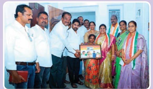
5 ఇందిరమ్మ ఇల్లు గృహప్రవేశాలలో ఎమ్మెల్యే