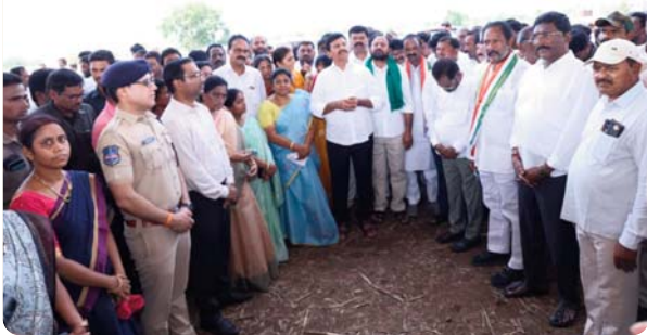
»» వారం రోజుల్లోనే రైతుల ఖాతాల్లోకి పైసలు...

అనంతరం మంత్రి పొంగులేటి శ్రీనివాస రెడ్డి విలేజ్ కు వెళ్లి మాట్లాడుతూ.. వరకాలం ప్రారంభమైన నేపథ్యంలో భారీ వర్షాల సూచనలు ఉన్నప్పటికీ, ఏ విపత్తు ఎదురైనా ఈ సభ అనుకున్న దానికంటే డబుల్, త్రిబుల్ సక్సెస్ అవుతుందని ధీమా వ్యక్తం చేశారు. గత రెండున్నరేళ్లుగా ఈ ప్రభుత్వం ఇచ్చిన ప్రతి మాటను అక్షరాలా నిలబెట్టుకుంటూ రైతు సంక్షేమమే ధ్యేయంగా పనిచేస్తోందన్నారు. ముఖ్యమంత్రి నాయకత్వంలో క్యాబినెట్ సాహసోపేత నిర్ణయం తీసుకుని, వరాలకు తడిసిన ధాన్యాన్ని సైతం మానవీయ కోణంలో కొనుగోలు చేసేందుకు గుర్తుచేశారు. కేవలం కొనడమే కాకుండా, కొన్న వారం రోజులలో పేరే రైతుల అకౌంట్లలో పైసలు వేసే నిర్ణయాన్ని రైతు పక్షపాత ప్రభుత్వం ఇది అని కొనియాడారు.