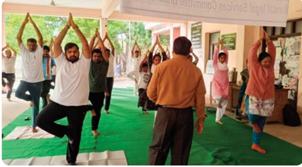
భద్రాచలం టౌన్, జూన్ 21