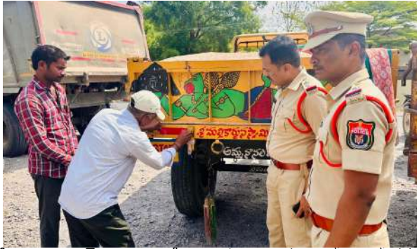
వీణవంక, జూన్ 20 (ప్రజాజ్యోతి) ఉన్నతాధికారుల ఆదేశాల మేరకు హుజూరాబాద్ నియోజకవర్గం లోని వీణవంక పోలీస్ స్టేషన్ పరిధిలో