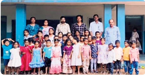
తో, చుట్టుపక్కల ప్రాంతాల విద్యార్థులు ఈ బడి వైపు పరుగులు తీస్తున్నారు.