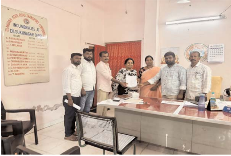
భూదాన్ పోచంపల్లి, జూన్ 19 (ప్రజాజ్యోతి):