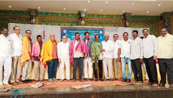
అస్సారావుపేట, మే 31, ప్రజాజ్యోతి: వ్యాపారాలందరినీ సమన్వయంతో కలుపుకుని పనిచేస్తు సంఘం అభివృద్ధికి కృషి చేస్తానని ఛాంబర్ ఆఫ్ కామర్స్ అధ్యక్షులు