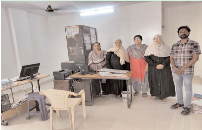
మిర్యాలగూడ, జూన్ 18, ( ప్రజాజ్యోతి ):

అసలే వర్షాలం... శిథిలావస్థలో ఉన్న ఉప కోశాధికారి కార్యాలయం.. బిక్కు బిక్కు మంటూ గడుపుతున్న సిబ్బంది ఇక్కట్లు తొలగిస్తూ.. గురువారం నూతన భవనంలోకి ప్రవేశించి కార్యకలాపాలు ప్రారంభించడం తో సిబ్బంది, పెన్షనర్లు ఊపిరి పీల్చుకున్నారు. సుమారు 50లక్షల రూపాయల వ్యయంతో చేపట్టిన నిర్మాణ పనులు సుమారు 4 నెలల క్రితం పూర్తయ్యాయి. భవనం సిద్దమైనప్పటికీ ప్రారంభానికి నోచుకోకపోవడంతో శిథిలావస్థలో ఉన్న భవనంలోనే విధులు నిర్వహించాల్సిన పరిస్థితి ఉండేది. ప్రారంభోత్సవానికి ఉన్నతాధికారుల గ్రీన్ సిగ్నల్ కోసం ఎదురు చూసారు. ఎంతకు ముహూర్తం నిర్ణయించబోవడంతో