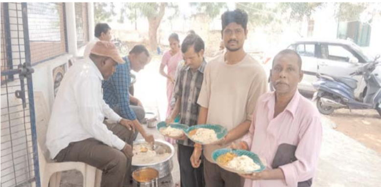
కోదాడ టౌన్, జూన్ 18 (ప్రజా జ్యోతి):