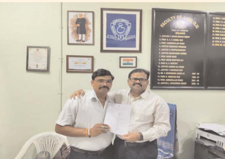
- సూర్యాపేట జిల్లా గుడుగుంటపాలెంలో హర్షాతిరేకాలు