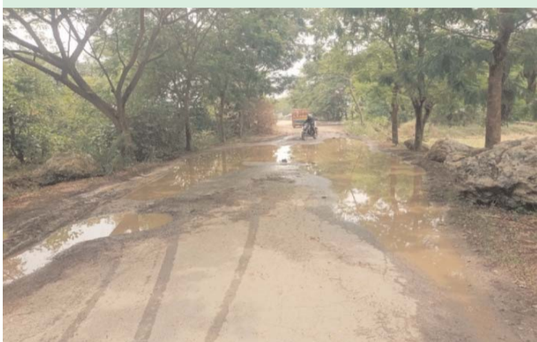
మోతె, జూన్ 18 (ప్రజా జ్యోతి):

చెన్నకేశవపురనికి వెళ్లే రహదారి పరిస్థితి ప్రజలకు శాపంగా మారిందని ప్రజలు చర్చించుకుంటున్నారు .ఇటీవల కురిసిన వర్షాలకు రోడ్డు పూర్తిగా దెబ్బతిని గుంతల మయంగా మారడంతో వర్షపు నీరు నిలిచి చెరువును తలపిస్తూ రోజు రోజుకు రోడ్డు గుంతలమయమై బురదతో నిండిపోవడంతో నిత్యం వాహనదారులు, బస్సు డ్రైవర్లు ప్రాణాలను అరచేతిలో పెట్టుకుని ప్రయాణించాల్సిన దుస్థితి నెలకొంది.అధికారులు మాత్రం కనీసం అటువైపు కన్నెత్తి చూడడం లేదని ప్రజలు ఆవేదన వ్యక్తం చేస్తున్నారు. రహదారి మధ్యలో భారీ గుంతలు, బురద నీరు పేరుకుపోవడంతో ఆర్టీసీ బస్సులు సైతం ప్రమాదకర పరిస్థితుల్లో ప్రయాణిస్తున్నాయి. విద్యార్థులు, ఉద్యోగులు, రైతులు, అత్యవసర సేవల కోసం వెళ్లే ప్రజలు తీవ్ర ఇబ్బందులు ఎదుర్కొంటున్నారు. ఎప్పుడు ఏ వాహనం గుంతలో ఇరుక్కుంటుందో, ఎప్పుడు ప్రమాదం జరుగుతుందో అన్న భయంతో ప్రయాణం కొనసాగించాలని గ్రామస్తులు ఆరోపిస్తున్నారు. వర్షాకాలం ప్రారంభమైన నేపథ్యంలో మరిన్ని ప్రమాదాలు చోటుచేసుకునే అవకాశం ఉందని ఆందోళన వ్యక్తం చేస్తున్నారు. ఇప్పటికైనా అధికారులు స్పందించి రహదారికి తక్షణమే మరమ్మతులు చేపట్టి ప్రజల కష్టాలను తొలగించాలని గ్రామస్తులు డిమాండ్ చేస్తున్నారు.