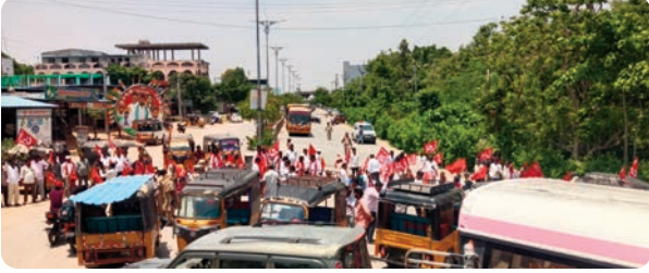
లసి వస్తుందనీ హెచ్చరించారు.

వైద్యం అందకపోవడం మూలంగా రోడ్డు మీదనే ప్రసవాలు జరిగిన చరిత్ర ఉన్నది. పాసింజర్ ఆటోలు బోల్తా పడిన సందర్భం ఉన్నది. ద్వీచక్ర వాహన దారులు అసుపత్రిపాల యూరు నడుము కాళ్ళు చేతులు విరిగిన చరిత్ర ఉన్నది అన్నారు. గత బి.ఆర్.ఎస్ ప్రభుత్వం పూర్తి చేయలేదు. అధికారంలోకి వచ్చి మూడు యేళ్లు కావొస్తున్న కూడ కాంగ్రెస్ చేయడం లేదు ఇందుకు ప్రభుత్వాలు సిగ్గుపడాలి అన్నారు. అన్నీ మా నుండి వస్తున్నాయి, కేంద్రం నుండి అని బి.జె.పి నాయకత్వం పడేపడే మాట్లాడుతుంటారు. ఈ ప్రాంతం ఎంపీ డి.కె. అరుణ గారైన కల్పించుకోవాలి. కేంద్ర నిధుల సుందైనా రోడ్డుని పూర్తి చేయాలి. ఎన్ని కలహుడు ప్రగల్భాలు పలికిన ఈ నాయకులు తరువాత మర్చిపోతారన్నారు. ఈ రోడ్డుకోసం గత నాలుగు ఏళ్లుగా ఆందోళనలు చేస్తున్నా కూడ ప్రభుత్వ అధికారులు, ప్రజాప్రతినిధులు ఏమాత్రం చలించడం లేదన్నారు. అధికారులు నాయకులు ఒక రిపై ఒకరు బొంతుతూ సమయం దాట వేస్తున్నారని అన్నారు. పనులు చేద్దాం అని ఎవరైనా ముందుకు వస్తే ముడుపులకోసం వేధిస్తున్నారని అన్నారు. అధికారులు, ప్రజాప్రతినిధులు ఇప్పటికైనా స్పందించి వెంటనే పూర్తి చేయాలని లేనిచో ప్రజాగ్రహానికి గురికావ