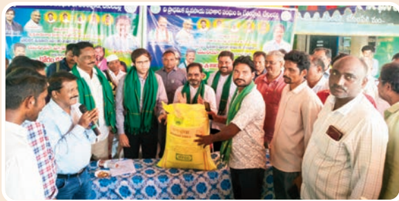
టేకులపల్లి, జూన్ 18, ప్రజాజ్యోతి: డంతో పాటు ఎరువుల పంపిణీలో రైతులకు యూరియా అందుబాటును మరింత సులభతరం చేయ మిగతా 2 లో... >