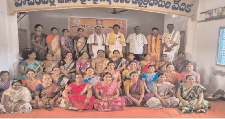
భూదాన్ పోచంపల్లి, జూన్ 14 (ప్రజాజ్యోతి)

ధర్మ జాగరణ సమితి--తెలంగాణ ఆధ్వర్యంలో భూదాన్ పోచంపల్లిలోని శ్రీ భక్తాంజనేయ స్వామి దేవాలయంలో ఐదు రోజుల పాటు నిర్వహించిన నిత్య పూజా విధాన శిక్షణ శిబిరం ఆదివారం విజయవంతంగా ముగిసింది. శిబిరంలో పాల్గొన్న వారికి నిత్య పూజా విధానం, దేవతారాధన, వివిధ పూజల నిర్వహణ, కర్మకాండలు, ఆచార వ్యవహారాలపై నిపుణులు శిక్షణ అందించారు. గ్రామాలు, పట్టణాల్లో ధార్మిక సేవలను మరింత సమర్థవంతంగా నిర్వహించేలా పురోహితులకు ఆచరణాత్మక అవగాహన కల్పించారు. ఈ సందర్భంగా నిర్వాహకులు మాట్లాడుతూ, సమాజంలో సనాతన ధర్మ పరిరక్షణకు ఇలాంటి శిక్షణా కార్యక్రమాలు ఎంతో ఉపయోగపడతాయని తెలిపారు. శిక్షణ పూర్తి చేసిన వారికి ధృవపత్రాలు అందజేసి, భవిష్యత్తులో మరిన్ని శిక్షణా శిబిరాలు నిర్వహించనున్నట్లు వెల్లడించారు.