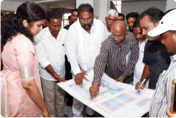
నారాయణపేట ప్రతినిధి జూన్ 12 (ప్రజాజ్యోతి) నారాయణపేట జిల్లా కేంద్రంలో నూతనంగా నిర్మిస్తున్న ఇంటిగ్రేటెడ్ డిస్ట్రిక్ట్ ఆఫీస్ కాంప్లెక్స్ (ఐ డి ఓ సి) పనులను రాష్ట్ర క్రీడా, పాడి పరిశ్రమా