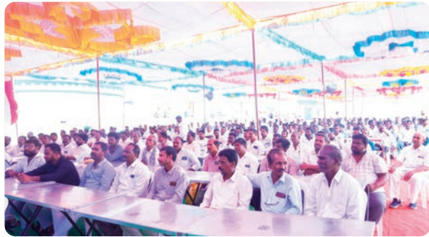
వదిలిపెట్టి చాలా ఏళ్లుగా వేరే ప్రాంతాల్లో స్థిరపడిన వారి ఓట్ల వివరాలను సరిచూడాలి. చనిపోయిన వారి పేర్లు ఇంకా ఓటర్ లిస్టులో కొనసాగకుండా ఫామ్-7 ద్వారా తగిన ఆధారాలతో వాటిని తొలగించేలా చర్యలు తీసుకోవాలి. 18 ఏళ్లు నిండిన ప్రతి యువతీ యువకుడికి కొత్తగా ఓటు హక్కు వచ్చేలా ఫామ్-6 ద్వారా నమోదు చేయించాలి. ప్రజాస్వామ్యం బ్రతకాలంటే ఓటర్ల జాబితా పారదర్శకంగా ఉండాలి అక్కడ ఒక ఓటు ఇక్కడ ఒక ఓటు వేసి ఎన్నికల తీర్పును తారుమారు చేసే పద్ధతికి స్వస్తి పలకాలి. చుట్టరికాలు మొహమాటాలు పక్కన పెట్టి ఖచ్చితమైన నిజాయితీతో కూడిన ఓటర్ల జాబితాను తయారు చేయడమే మన కాంగ్రెస్ సైనికుల ప్రథమ కర్తవ్యం బూత్ స్థాయిలో మనం చేసే ఈ శ్రమ రాబోయే విజయానికి పునాది అవుతుంది అని మాట్లాడారు. కార్యక్రమంలో, ప్రజాప్రతినిధులు కార్యకర్తలు తదితరులు పాల్గొన్నారు.