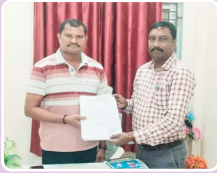
శారు. మండలంలోని అన్ని పాఠశాలల్లో తాగునీటి సౌకర్యం, మరుగుదొడ్డు,