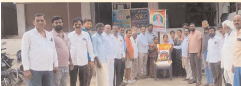
ఆలేరు జూన్ 7 ప్రజా జ్యోతి