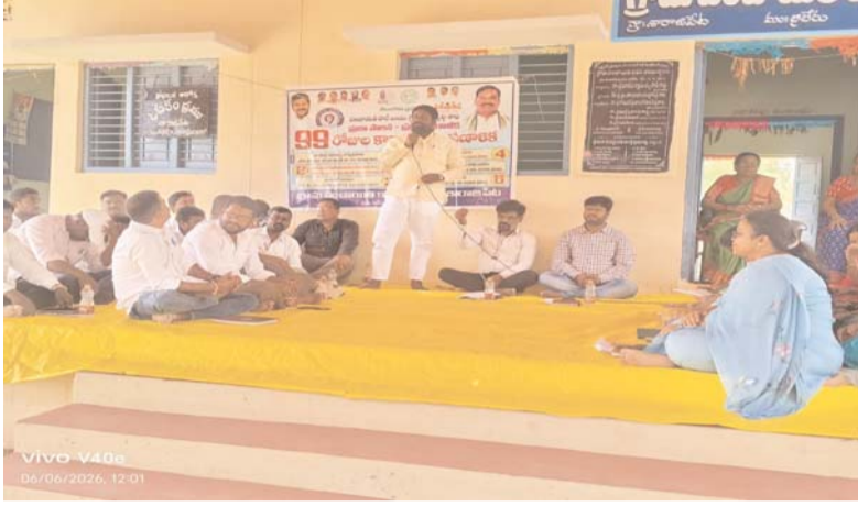
ఆలేరు జూన్ 6 ప్రజా జ్యోతి