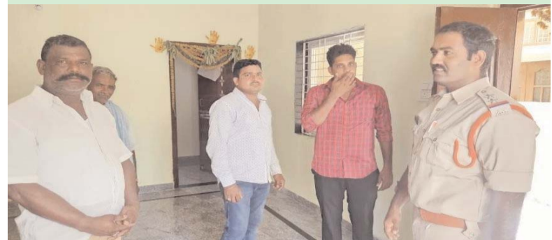
మోతుూరు, జూన్ 6 (ప్రజా జ్యోతి):