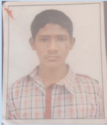
రాజుపేట జూన్ 5 (ప్రజా జ్యోతి )