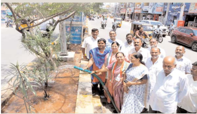
పిలుపునిచ్చారు. ప్రపంచ పర్యావరణ దినోత్సవం సందర్భంగా శు