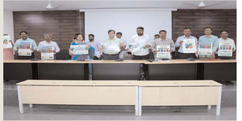
స్వచ్ఛమైన గ్రామాలు -- ఆరోగ్యకరమైన సమాజం లక్ష్య సాధనలో ప్రజల భాగస్వామ్యం ఎంతో కీలకమని పేర్కొన్నారు.

గ్రామాలు, పట్టణాలను మరింత పరిశుభ్రంగా, ఆరోగ్యకరంగా తీర్చిదిద్దే దిశగా మరో ముందడుగు పడింది. స్వచ్ఛత, పర్యావరణ పరిరక్షణ మరియు శాస్త్రీయ ఘన వ్యర్థాల నిర్వహణకు ప్రాధాన్యతనిస్తూ ఎస్ డబ్ల్యూయం--2026 నిబంధనల పోస్టర్ను అధికారులు ఆవిష్కరించారు. ఈ సందర్భంగా ఘన వ్యర్థాలను శాస్త్రీయ పద్ధతుల్లో నిర్వహించడం ద్వారా పర్యావరణ కాలుష్యాన్ని తగ్గించడంతో పాటు ప్రజారోగ్యాన్ని కాపాడవచ్చని అధికారులు తెలిపారు. ఇంటి వద్దే తడి, పొడి చెత్తను వేరు చేసి అందించడం ద్వారా పరిశుభ్రమైన పరిసరాల నిర్మాణానికి ప్రతి ఒక్కరూ సహకరించాలని కోరారు. ప్రజల్లో అవగాహన పెంచేందుకు ప్రత్యేక ప్రచార కార్యక్రమాలు, శిబిరాలు నిర్వహించనున్నట్లు వెల్లడించారు.