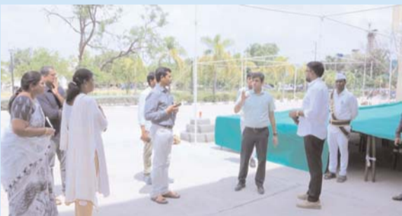
భువనగిరి, జూన్ 1 (ప్రజా జ్యోతి న్యూస్):

ఎలాంటి అసౌకర్యం లేకుండా అన్ని ఏర్పాట్లు పూర్తి చేయాలని అధికారులకు కలెక్టర్ ఆదేశం