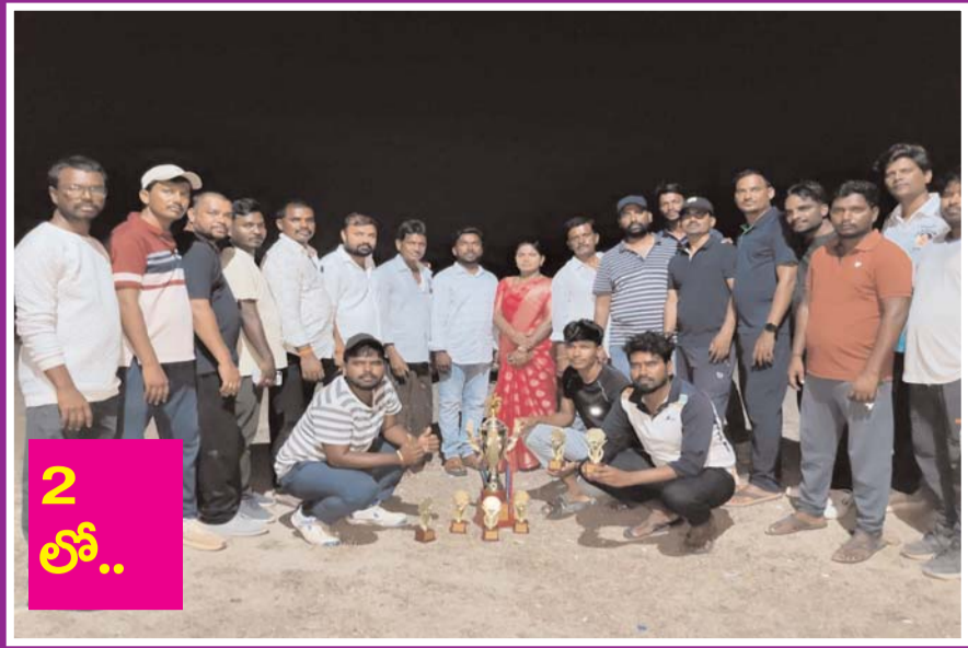
క్రీడలతో మానసిక ఉల్లాసం