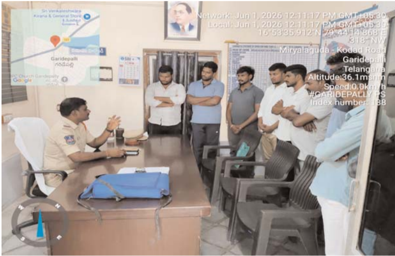
గరిడేపల్లి, జూన్ 01 (ప్రజా జ్యోతి):

డీజే యజమానులు, నిర్వాహకులు ప్రభుత్వ నిబంధనలను తప్పనిసరిగా పాటించాలని గరిడేపల్లి ఎస్ఐ బి. శ్రీకాంత్ గౌడ్ సూచించారు. సోమ వారం గరిడేపల్లి పోలీస్ స్టేషన్లో డీజే నిర్వాహకులకు నిర్వహించిన కౌన్సిలింగ్లో ఆయన మాట్లాడారు. రాబోయే పండుగలు, వివాహాలు, శుభకార్యాల నేపథ్యంలో శాంతిభద్రతల పరిరక్షణ కోసం డీజే యజమానులను ఔండోవర్ చేసినట్లు తెలిపారు. సంబంధిత అధికారుల అనుమతులు లేకుండా డీజే కార్యక్రమాలు నిర్వహించడం చట్టవిరుద్ధమని, అనుమతులు పొందినప్పటికీ శబ్ద పరిమితులను తప్పనిసరిగా పాటించాలని సూచించారు. నిబంధనలు ఉల్లంఘించి అధిక శబ్దంతో డీజేలు నిర్వహిస్తే చట్టపరమైన చర్యలు తీసుకోవడం తో పాటు సౌండ్ సిస్టమ్లను స్వాధీనం చేసుకుని సీజ్ చేస్తామని హెచ్చరించారు. ప్రజలకు ఇబ్బందులు కలగకుండా నిర్వాహకులు బాధ్యతాయుతంగా వ్యవహరించాలని ఎస్ఐ కోరారు.