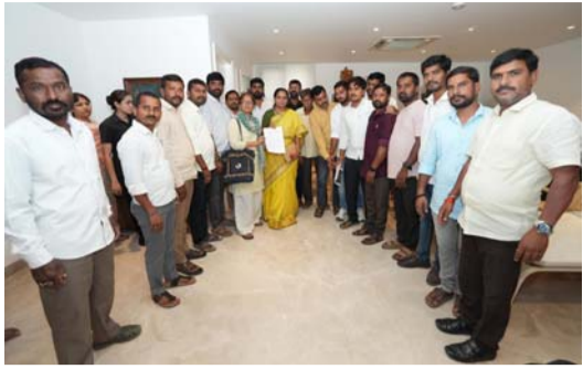
ఏర్పడితే రైతులకు అండగా ఉంటామని కాంగ్రెస్ నేతలు

కవితకు వినతి అందజేసిన ఫార్మా బాధిత రైతులు అఖిలపక్ష సమావేశానికి హాజరయ్యారని కోరిన రైతులు యాచారం, మే 05 (ప్రజా జ్యోతి): ఫార్మానీటి, పూర్వర సీటీ నాలుగు గ్రామాల భూ బాధిత రైతులు మంగళవారం తెలంగాణ రక్షణ సేన అధ్యక్షురాలు కవితను కలిసి వినతి అందజేశారు. అనంతరం ఫార్మానీటి, పూర్వర సీటీ పేరుతో రైతులు ఎదుర్కొంటున్న సమస్యల్ని కవిత దృష్టికి తీసుకెళ్లారు. ఈ ప్రాంతంలో ఫార్మానీటి ఏర్పాటు చేయద్దని నాటి నుంచి రైతులు, ప్రజలంతా పటిష్టమైన వ్యతిరేకతను తెలుపుతూ రైతుల బాధలు గత ప్రభుత్వానికి పట్టలేదని విన్నవించారు. కాంగ్రెస్ ప్రభుత్వం