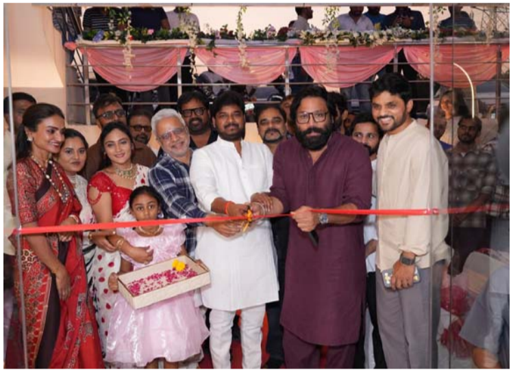
జూబ్లీహిల్స్, మే 3 (ప్రజాజ్యోతి) నగరంలో దంత వైద్య రంగంలో కొత్త ప్రమాణాలను నెలకొల్పడానికి "ప్రియాంకాస్ ఇన్స్టిట్యూట్ ఫర్ డెన్టల్ సైన్సెస్" క్లినిక్ ఘనంగా ప్రారంభమైంది. ప్రముఖ దంత వైద్య నిపుణులు రాబోయే దినాల్లో దానిని నిర్వహించేందుకు ప్రయత్నం చేస్తున్నారు.

జూబ్లీహిల్స్, మే 3 (ప్రజాజ్యోతి) నగరంలో దంత వైద్య రంగంలో కొత్త ప్రమాణాలను నెలకొల్పడానికి "ప్రియాంకాస్ ఇన్స్టిట్యూట్ ఫర్ డెన్టల్ సైన్సెస్" క్లినిక్ ఘనంగా ప్రారంభమైంది. ప్రముఖ దంత వైద్య నిపుణులు రాబోయే దినాల్లో దానిని నిర్వహించేందుకు ప్రయత్నం చేస్తున్నారు. ప్రముఖ దంత వైద్య నిపుణులు రాబోయే దినాల్లో దానిని నిర్వహించేందుకు ప్రయత్నం చేస్తున్నారు. ప్రముఖ దంత వైద్య నిపుణులు రాబోయే దినాల్లో దానిని నిర్వహించేందుకు ప్రయత్నం చేస్తున్నారు.