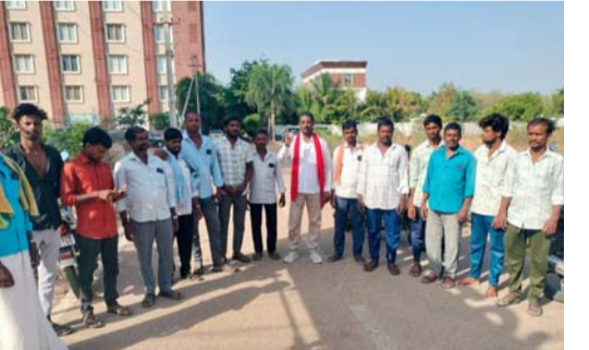
పనిచేస్తున్న సందర్భంలో ప్రమాదం జరిగి మరణిస్తే ప్రమాద బీమా 10 లక్షల రూపాయల ప్రభుత్వ సంక్షేమ బోర్డు నుండి ఆ యొక్క ఆర్థిక సాయం అందుతుందని అన్నారు. కార్మికులు అనారోగ్యంతో సహజ మరణం చెందతే 2 లక్షల రూపాయలు,