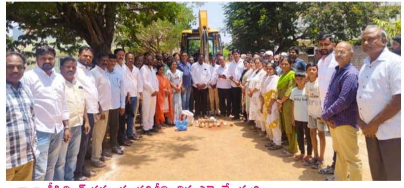
- నాలా డీసీల్లింగ్ పనులను పరిశీలించిన ఎమ్మెల్యే మర్రి రాజశేఖర్ రెడ్డి -- వర్షాకాలానికి ముందే మౌలిక వసతుల బలోపేతానికి చర్యలు

అల్వాల్ మే 30 ప్రజాజ్యోతి: మల్కొండగిరి నియోజకవర్గంలోని తుర్కపల్లి డివిజన్లో అభివృద్ధి కార్యక్రమాలు వేగంగా కొనసాగుతున్నాయి. ప్రజలకు మెరుగైన మౌలిక వసతులు అందించాలనే లక్ష్యంతో రూ.45.50 లక్షల వ్యయంతో చేపట్టిన సీసీ రోడ్డు నిర్మాణ పనులను మల్కొండగిరి ఎమ్మెల్యే మర్రి రాజశేఖర్ రెడ్డి శుక్రవారం ప్రారంభించారు. అల్వాల్ సర్కిల్ ఇంజనీరింగ్ అధికారులు, స్థానిక కాలనీవాసులు, బీఆర్ఎస్ నాయకులతో కలిసి ఆయన ఈ కార్యక్రమంలో పాల్గొన్నారు. ఈ సందర్భంగా రాయల్ ఎస్టేట్ రోడ్ నెం.12లో రూ.13 లక్షల వ్యయంతో చేపట్టిన సీసీ రోడ్డు నిర్మాణ పనులకు, అలాగే సిద్ది వినాయక్ నగర్లో రూ.32.50 లక్షల వ్యయంతో చేపట్టనున్న సీసీ రోడ్డు పనులకు ఎమ్మెల్యే శంకుస్థాపన చేశారు. ఈ రహదారుల నిర్మాణంతో స్థానిక ప్రజలు ఎదుర్కొంటున్న రవాణా సమస్యలు తొలగి, కాలనీల్లో ప్రయాణ సౌకర్యం మరింత మెరుగుపడుతుందని స్థానికులు హర్షం వ్యక్తం చేశారు. అనంతరం అల్వాల్ సర్కిల్ పరిధిలో రూ.40 లక్షల వ్యయంతో చేపడుతున్న నాలా డీసీల్లింగ్ పనులను ఎమ్మెల్యే మర్రి రాజశేఖర్ రెడ్డి స్వయంగా పరిశీలించారు. రాజోయ్ వర్షాకాలాన్ని దృష్టిలో ఉంచుకుని నాలాలో పేరుకుపోయిన