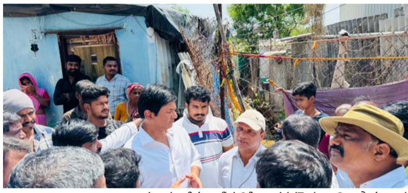
మట్టి, చెత్తాచెదారం మరియు ఇతర వ్యర్థాలను పూర్తిస్థాయిలో తొలగించాలని అధికారులకు స్పష్టమైన ఆదేశాలు జారీ చేశారు. వర్షపు నీరు ఎటువంటి అటంకం లేకుండా ప్రవహించేలా చర్యలు తీసుకోవాలని సూచించారు.

అల్వాల్ మే 30 ప్రజాజ్యోతి: మల్కొండగిరి నియోజకవర్గంలోని తుర్కపల్లి డివిజన్లో అభివృద్ధి కార్యక్రమాలు వేగంగా కొనసాగుతున్నాయి. ప్రజలకు మెరుగైన మౌలిక వసతులు అందించాలనే లక్ష్యంతో రూ.45.50 లక్షల వ్యయంతో చేపట్టిన సీసీ రోడ్డు నిర్మాణ పనులను మల్కొండగిరి ఎమ్మెల్యే మర్రి రాజశేఖర్ రెడ్డి శుక్రవారం ప్రారంభించారు. అల్వాల్ సర్కిల్ ఇంజనీరింగ్ అధికారులు, స్థానిక కాలనీవాసులు, బీఆర్ఎస్ నాయకులతో కలిసి ఆయన ఈ కార్యక్రమంలో పాల్గొన్నారు. ఈ సందర్భంగా రాయల్ ఎస్టేట్ రోడ్ నెం.12లో రూ.13 లక్షల వ్యయంతో చేపట్టిన సీసీ రోడ్డు నిర్మాణ పనులకు, అలాగే సిద్ది వినాయక్ నగర్లో రూ.32.50 లక్షల వ్యయంతో చేపట్టనున్న సీసీ రోడ్డు పనులకు ఎమ్మెల్యే శంకుస్థాపన చేశారు. ఈ రహదారుల నిర్మాణంతో స్థానిక ప్రజలు ఎదుర్కొంటున్న రవాణా సమస్యలు తొలగి, కాలనీల్లో ప్రయాణ సౌకర్యం మరింత మెరుగుపడుతుందని స్థానికులు హర్షం వ్యక్తం చేశారు. అనంతరం అల్వాల్ సర్కిల్ పరిధిలో రూ.40 లక్షల వ్యయంతో చేపడుతున్న నాలా డీసీల్లింగ్ పనులను ఎమ్మెల్యే మర్రి రాజశేఖర్ రెడ్డి స్వయంగా పరిశీలించారు. రాజోయ్ వర్షాకాలాన్ని దృష్టిలో ఉంచుకుని నాలాలో పేరుకుపోయిన