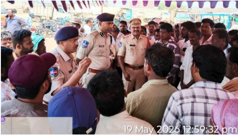
19 May 2026 12:59:32 pm

తనిఖీలు చేశారు. ఈ సందర్భంగా యజమానులకు, వ్యాపారులకు, రవాణా డ్రైవర్లకు పలు కీలకమైన సూచనలు చేశారు. పశువుల అక్రమ వధ, పశువులపై క్రూరత్వం నియంత్రించాలని, పశువుల సురక్షిత రవాణా కోసం నిబంధనలు పాటించాలని ఆదేశించారు. పశువైద్య అధికారి పశువుల ఆరోగ్య పరిస్థితిని పరిశీలించాక రవాణాకు ముందు సరైన ఫిట్నెస్ సర్టిఫికేట్లు జారీ చేయాలని ఆదేశించారు. సరైన గాలి, ఆహారం, నీరు అవసరమైన జాగ్రత్తలు లేకుండా పశువులను అధిక సంఖ్యలో వాహనాల్లో తరలించవద్దని హెచ్చరించారు. ద్రవ్య తప్పనిసరిగా చెల్లుబాటు అయ్యే పత్రాలను కలిగి ఉండాలని,