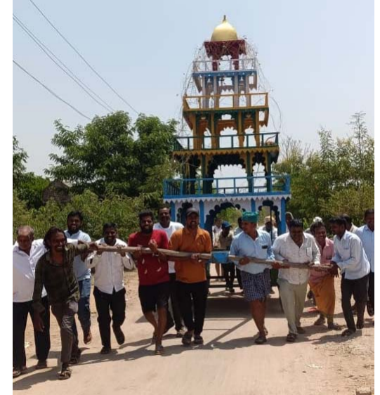
జాతర సమీపిస్తుండటంతో తిమ్మకపల్లి గ్రామం మొత్తం భక్తి శోభతో కళకళలాడుతోంది.

మరియు గ్రామ ప్రజలు పెద్ద ఎత్తున పాల్గొన్నారు. గ్రామ ప్రజలంతా ఐక్యంగా జాతర ఏర్పాటులో పాల్గొనడం ద్వారా గ్రామ ఏకతా భావం ప్రతిఫలించింది. గ్రామ పెద్దలు మాట్లాడుతూ, నల్ల పోచమ్మ జాతర తిమ్మకపల్లి గ్రామానికి ఎంతో ప్రాచీనమైన సంప్రదాయ పండుగ అని, ఈ జాతర కోసం గ్రామ ప్రజలు వారం రోజుల ముందుగానే పనులు ప్రారంభించడం ఆనవాయితీగా కొనసాగుతోందన్నారు. ఇంటింటా శుభ్రపరిచే కార్యక్రమాలు, పండుగ కొనుగోళ్లు, బంధువులను ఆహ్వానించడం, ప్రత్యేక వంటకాలు సిద్ధం చేయడం వంటి పనులతో గ్రామమంతా సందడిగా మారిందని తెలిపారు. జాతర రోజున ప్రత్యేక పూజలు, బోనాలు, హారతులు, సంప్రదాయ కళా ప్రదర్శనలు, గ్రామస్థుల భక్తి కార్యక్రమాలు నిర్వహించనున్నట్లు నిర్వాహకులు వెల్లడించారు. సమీప గ్రామాల నుండి కూడా భక్తులు పెద్ద సంఖ్యలో హాజరవుతారని అంచనా వేస్తున్నారు. నల్ల పోచమ్మ జాతర కేవలం ఆధ్యాత్మిక వేడుక మాత్రమే కాకుండా గ్రామ సంస్కృతి, సంప్రదాయం, సామాజిక ఐక్యతను ప్రతిబింబించే మహోత్సవంగా నిలుస్తుందని గ్రామస్థులు పేర్కొన్నారు.