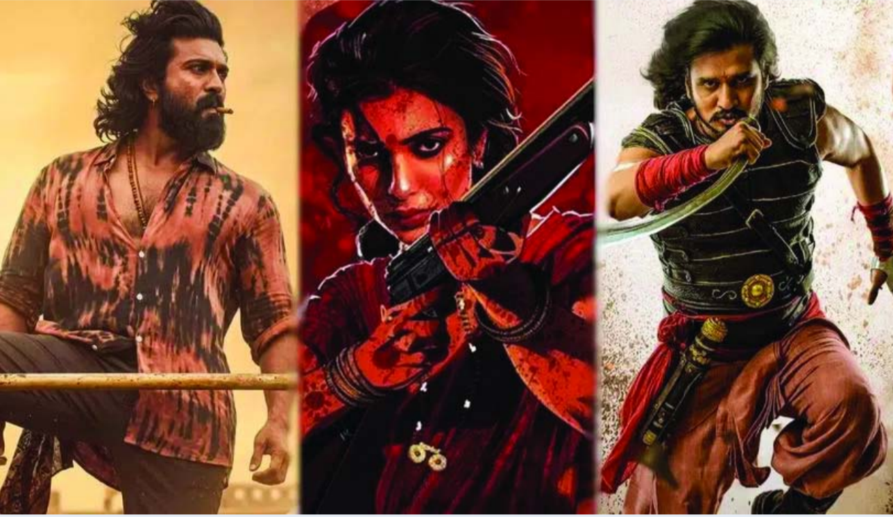
సిద్ధమవుతున్నాయి. ఇక వీటిలో ఏ సినీమా బాక్సాఫీస్ వద్ద సంచలనం సృష్టిస్తుందో చూడాలి.

ఒకేసారి నాలుగు సినిమాలు థియేటర్లలోకి రాబోతున్నాయి. 'బాలన్ ది బాయ్', 'ట్రాన్స్ ఫర్ ట్రిమూర్లు', హీరో కామెడీ మూవీ 'చెట్టు మీద దెయ్యం నాకేం భయం', అలాగే ఫ్యామిలీ ఎమోషన్ తో తెరకెక్కిన 'మా ఇంటి బంగారం' సినీమాలు ఒకేరోజు విడుదల కానున్నాయి. ఈ నాలుగు చిత్రాలు పూర్తిగా భిన్నమైన జోనర్లలో ఉండటంతో ప్రేక్షకులకు మంచి ఎంటర్టైన్మెంట్ ప్యాకేజీ లభించే అవకాశం ఉంది. ముఖ్యంగా హీరో కామెడీ సినీమాలకు ఇటీవల మంచి ఆదరణ లభిస్తున్న నేపథ్యంలో 'చెట్టు మీద దెయ్యం నాకేం భయం'పై ప్రత్యేక ఆసక్తి కనిపిస్తోంది. జూన్ చివరి వారం మాత్రం బాక్సాఫీస్ వద్ద భారీ హంగామా ఉండనుంది. జూన్ 26న పీరియాడిక్ యాక్షన్ డ్రామా 'స్వయంభూ' విడుదల కానుంది. ఈ సినీమాపై ఇప్పటికే సినీ వర్గాల్లో మంచి బజ్ నెలకొంది. అదే రోజున స్పోర్ట్స్ డ్రామా 'సూపర్ గోల్' కూడా ప్రేక్షకుల ముందుకు రానుంది. ఇక రాజకీయ నేపథ్యంతో తెరకెక్కిన ఇంటెన్స్ డ్రామా 'లెనిన్' కూడా జూన్ 26నే విడుదల కానుండటం విశేషం. దీంతో నెలాఖరులో మూడు ప్రధాన చిత్రాలు ఒకేసారి బాక్సాఫీస్ బరిలోకి దిగనున్నాయి. మొత్తం మీద చూస్తే 2026 జూన్ నెల టాలీవుడ్ ప్రేక్షకులకు పుల్ ఎంటర్టైన్మెంట్ ఇప్పటితోందనే చెప్పాలి. భారీ పాన్ ఇండియా సినిమాలు నుంచి చిన్న కాన్సెప్ట్ మూవీస్ వరకు అన్ని రకాల చిత్రాలు ప్రేక్షకులను అలరించేందుకు