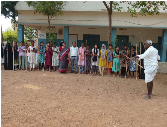
కల్పించేందుకు ఈ కార్యక్రమాలను ప్రత్యేకంగా నిర్వహిస్తున్నారు. 14 నుండి 18 సంవత్సరాల మధ్య వయస్సు గల బాలికలతో ఏర్పాటు చేసిన ఈ సంఘాల ద్వారా రక్తహీనత, పోషకాహారం, వ్యక్తిగత పరిశుభ్రత,

కామారెడ్డి రూరల్, మే 26 (ప్రజా జ్యోతి): రాజంపేట మండలంలోని వివిధ గ్రామాలలో కిషోర్ బాలికల అభివృద్ధి లక్ష్యంగా ప్రభుత్వం ఆధ్వర్యంలో నిర్వహిస్తున్న "స్నేహ సంఘాల" సమ్మర్ క్యాంపులు ఉత్సాహంగా కొనసాగుతున్నాయి. బాలికల ఆరోగ్యం, వ్యక్తిత్వ వికాసం, మానసిక దైర్యం మరియు విద్యా అవకాశాలపై అవగాహన