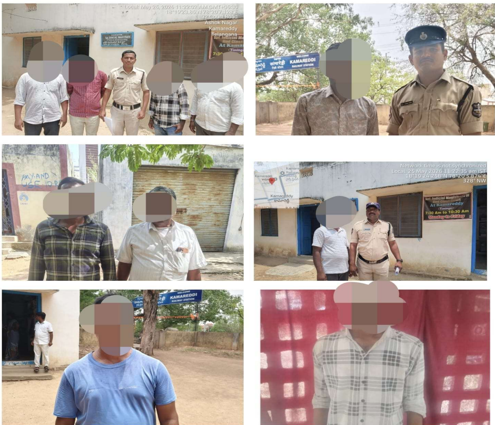
తప్పనిసరిగా పాటించారు. జిల్లాలో డ్రంక్ అండ్ డ్రైవ్ తనిఖీలు నిరంతరం జలాగే కొనసాగుతాయని స్పష్టం చేశారు.