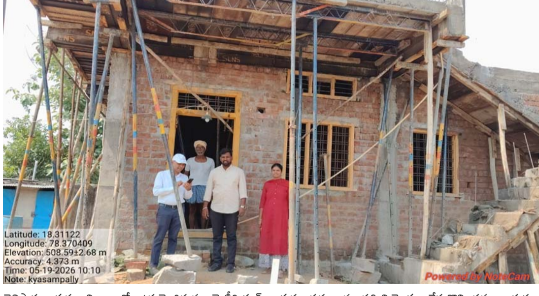
తెలిపారు. గృహ నిర్మాణాల్లో ఉపయోగిస్తున్న మెటీరియల్, సాంకేతిక అంశాలపై కూడా వివరాలు అడిగి తెలుసుకున్నారు. ఈ సందర్భంగా గ్రామస్థులు హౌసింగ్ పథకాల అమలుపై అధికారులకు పలు సూచనలు చేశారు. ప్రభుత్వం అందిస్తున్న

హౌసింగ్ పీడీ విజయ పాల్ రెడ్డి ఆకస్మిక తనిఖీ పనుల నాణ్యతపై అధికారుల సమీక్ష