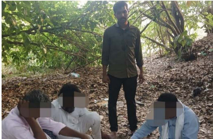
మరియు 3 మొబైల్ ఫోన్లు స్వాధీనం చేసుకున్నారు. రెండు

కామారెడ్డి ప్రతినధి మే 15. (ప్రజాజ్యోతి) కామారెడ్డి జిల్లా పోలీస్ శాఖ ఆధ్వర్యంలో జూదం వంటి చట్టవిరుద్ధ కార్యకలాపాలపై ప్రత్యేక దృష్టి సారించి నిరంతరంగా దాడులు నిర్వహిస్తున్నారు. విశ్వసనీయ సమాచారం మేరకు లింగంపేట్ పోలీస్ స్టేషన్ పరిధిలో నిర్వహించిన దాడిలో ముగ్గురు వ్యక్తులను అదుపులోకి తీసుకుని, వారి వద్ద నుంచి 3 మొబైల్ ఫోన్లు, 3 ద్వితీయ వాహనాలు మరియు నగదు రూ. 2,590 స్వాధీనం చేసుకున్నారు. అదేవిధంగా పిట్లం పోలీస్ స్టేషన్ పరిధిలో తిమ్మానగర్ కల్లు కాంపౌండ్ ఎదురుగా ఉన్న ఖాళీ ప్రదేశంలో నిర్వహించిన దాడిలో నలుగురు వ్యక్తులను అదుపులోకి తీసుకుని, వారి వద్ద నుంచి రూ. 5,350 నగదు