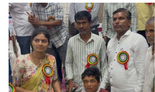
సందర్భంగా తల్లిదండ్రులు తమ దివ్యాంగులైన పిల్లలు

గాంధారి, మే 15 (ప్రజాజ్యోతి) గాంధారి మండల కేంద్రంలోని దివ్యాంగులకు వివిధ రకాల ఉపకరణాలను శుక్రవారం పంపిణీ చేశారు. గత ఏడాది సెప్టెంబర్ నెలలో జిల్లా పరిషత్ ఉన్నత పాఠశాల (బామ్మో)లో జిల్లాలోని అన్ని మండలాల దివ్యాంగుల కోసం నిర్వహించిన నిర్ధారణ శిబిరంలో ఎంపికైన లబ్ధిదారులకు ఈ ఉపకరణాలను అందజేశారు. సర్వ శిక్ష అభియాన్ మరియు అలింకో సంస్థ ఆధ్వర్యంలో నిర్వహించిన ఈ నిర్ధారణ శిబిరంలో మండలంలోని వివిధ గ్రామాలకు చెందిన 12 మంది దివ్యాంగులు పాల్గొన్నారు. వీరికి అవసరాల మేరకు వీల్ చైర్లు, ట్రైసైకిళ్లు, వాకర్లు, నాయిస్ రికార్డర్లు, ట్రెయిలి కిట్లు తదితర ఉపకరణాలను పంపిణీ చేశారు. ఈ