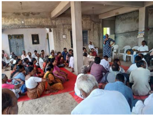
భూములు సేకరించకుండా అందగా ఉంటామని హామీ ఇచ్చారని గుర్తు చేశారు. కానీ అధికారంలోకి వచ్చి ఏళ్లు గడుస్తున్నా ఫార్మా రైతులను కాంగ్రెస్ ప్రభుత్వం విస్మరిస్తూనే ఉందని అన్నారు. నాడు కాంగ్రెస్ నేతలు రైతులకు ఇచ్చిన

యాచారం, మే 21 (ప్రజాజ్యోతి): ప్రభుత్వం చేపడుతున్న చట్ట వ్యతిరేక పనుల్ని వెంటనే నిలిపివేయాలని ఫార్మా ఊివో రద్దు చేయాలని ఏది ఏమైనా మా భూములు మాకు కావాలని రైతులు పెద్ద ఎత్తున మరో మారు నినదించారు. ఫార్మా బాధిత గ్రామమైన మేడిపల్లిలో ఫార్మాసిటీ వ్యతిరేక పోరాట కమిటీ సభ్యులు అధ్యక్షులలో నాలుగు గ్రామాల ఫార్మా బాధిత రైతులు, కూలీలు గురువారం మరో మారు సమావేశమయ్యారు. కమిటీ సభ్యులు మాట్లాడారు. గత ప్రభుత్వంలో ఉన్న ప్రతిపక్ష కాంగ్రెస్ నేతలు ఈ ప్రాంతంలో ఫార్మాసిటీ రెవెన్యూను రైతుల